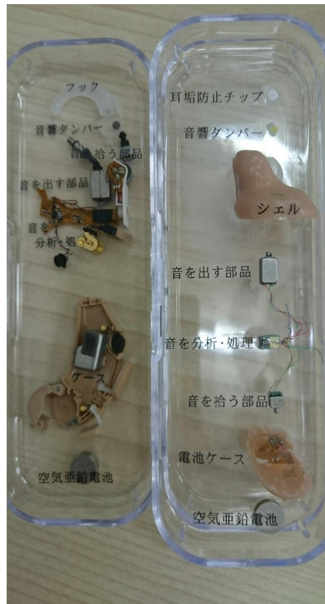
耳あな型と耳かけ型の分解模型

修理前に不良箇所が特定できている場合は、分解模型を見せながら事前に不良箇所の説明と費用、不良になった理由などを説明します。また、修理品をお客様へ返却する際にも分解模型を見せながら交換した部分と理由を説明します。