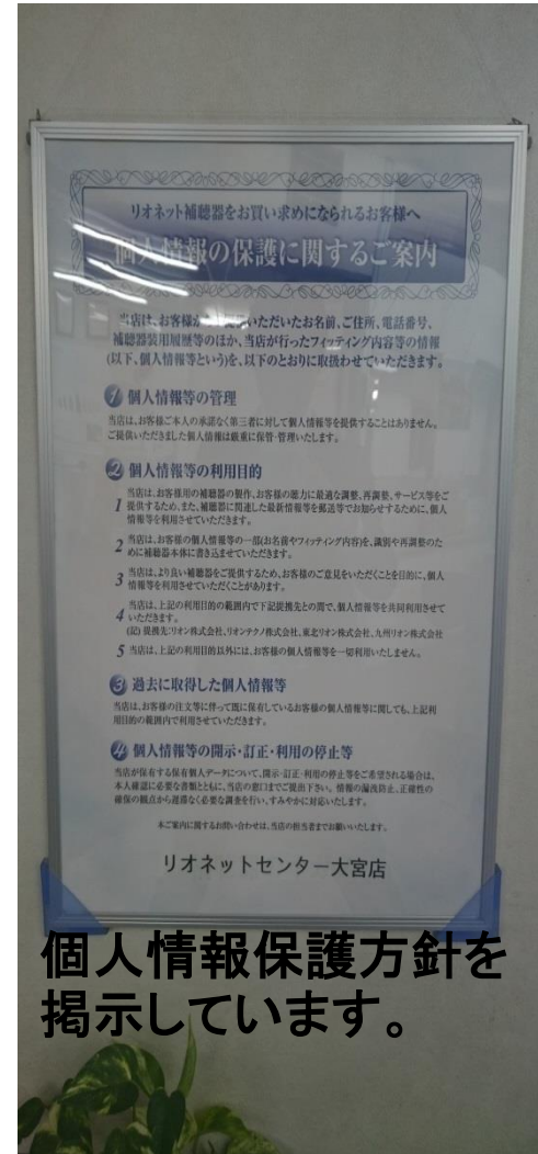
個人情報保護方針を 掲示しています。

また、記録媒体の暗号化とPCなどの電子機器はパスワード使用で個人の情報を守ります。